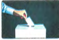
( ج )